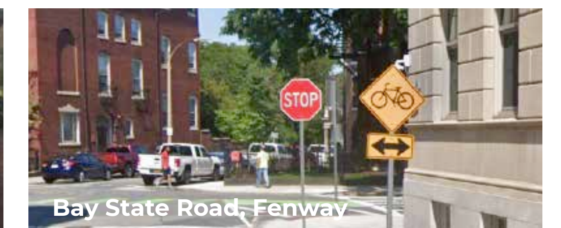
Bay State Road, Fenway La señalización avisa a los conductores que se acercan por las calles laterales que pueden circular en bicicleta en ambos sentidos