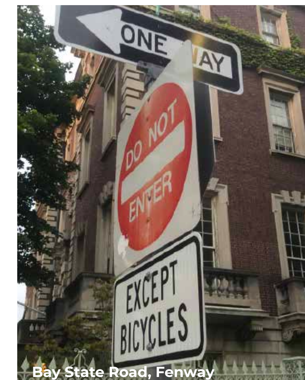
Bay State Road, Fenway La señalización indicará que los ciclistas pueden entrar en Eliot Street.