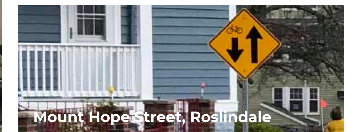
Mount Hope Street, Roslindale La señalización avisa a los conductores que entran en la calle de la circulación bidireccional de bicicletas